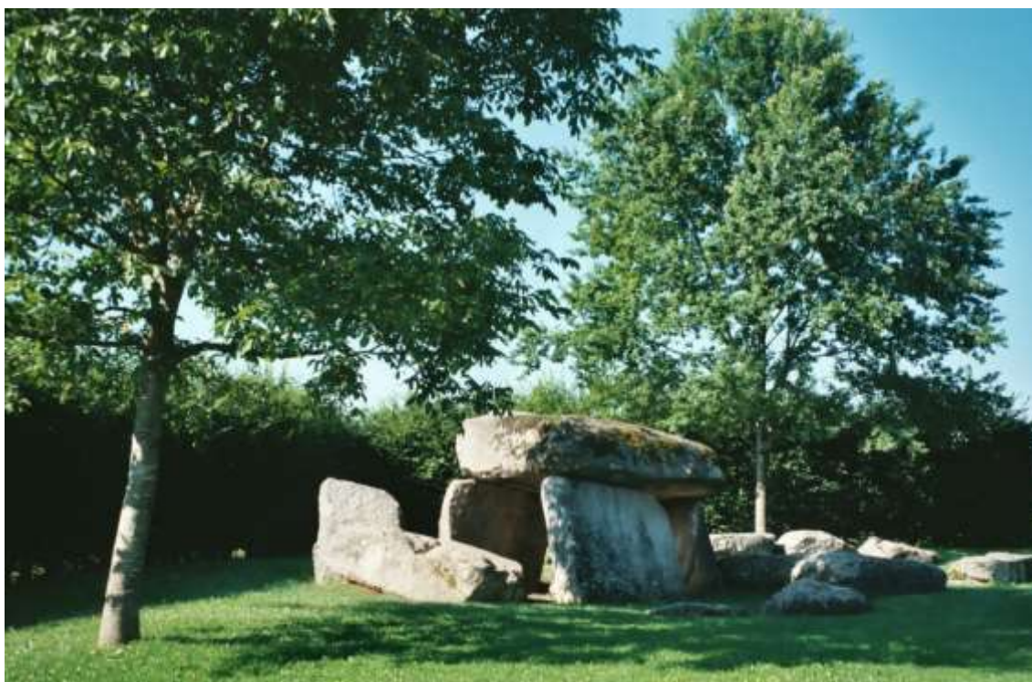
La Pierre de la Fée Véra

Tout en marchant il se souvenait du jour où le mystère du monument se révéla véritablement à lui. C'était un après-midi alors que l'orage grondait alentours, comme à l'accoutumée, il avait pris place sur la pierre de méditation. Ce jour-là, un phénomène très inhabituel se produisit. Insensiblement son corps et son esprit furent envahis par un flux désordonné et puissant venu du tréfonds de la terre. En peu de temps, cette force tellurique qui le submergeait restaura son mana, lui procurant des forces nouvelles et durables, tant physiques que