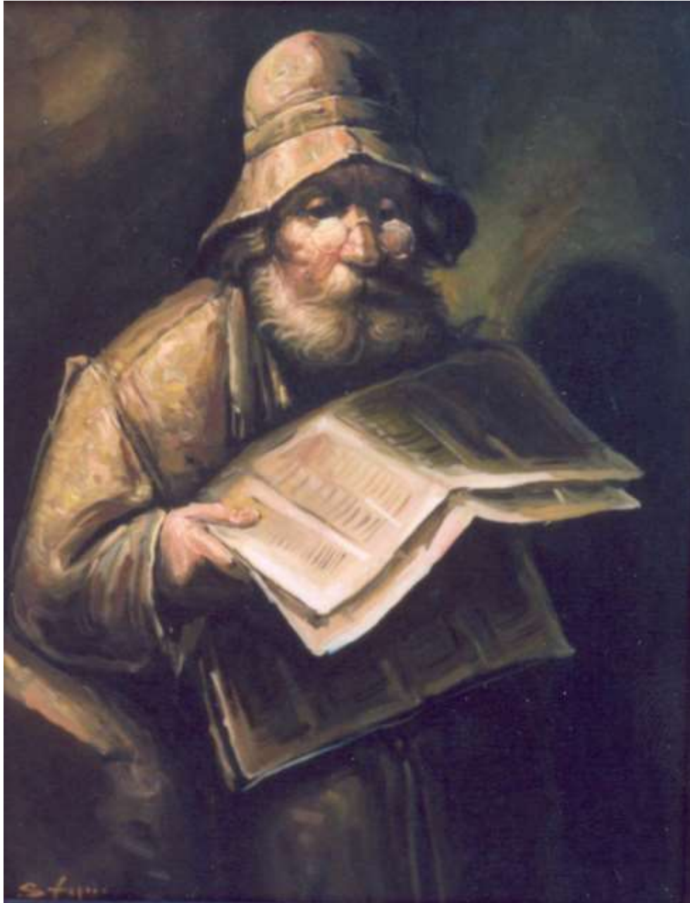
Portrait de l'Homme